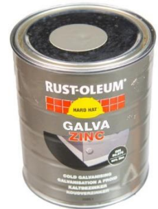
Figur 2: Sinkmaling til gjengeparti