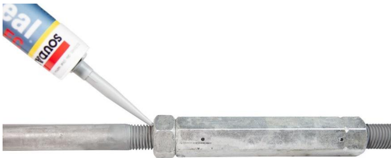
Figur 3: Påføring av tettemasse

Produkt og sikkerhetsdatablad fås på forespørsel eller lastes ned på www.pretec.no .