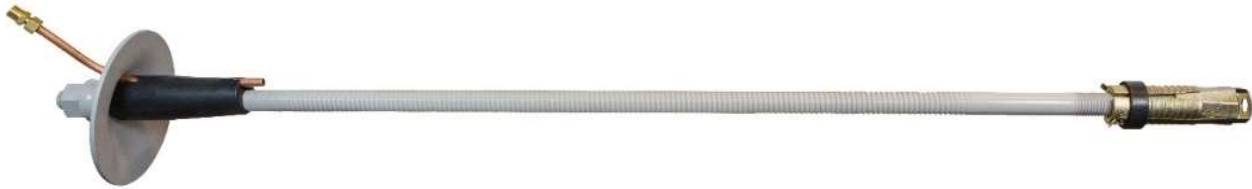
Pc-Bolt™ with Pc-Packer, ready for installation