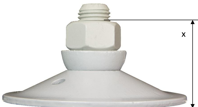
M27/15 med halvkule og løs mutter