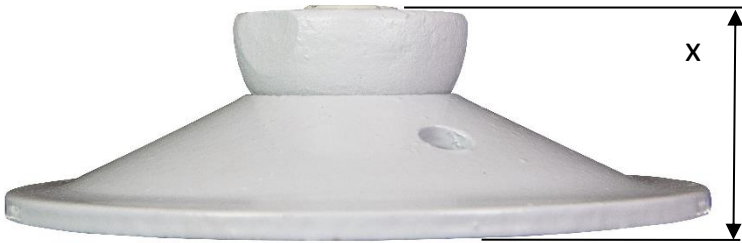
M27/15 with threaded half ball