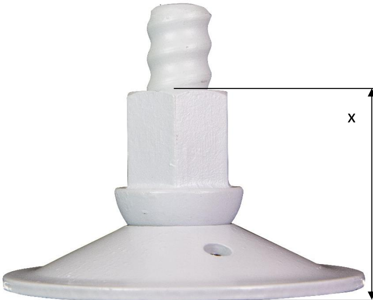
R27 with dome nut