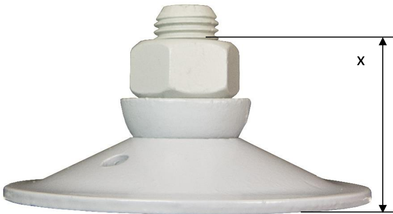
M27/15 with half ball and nut