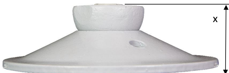
M27/15 med gjenget halvkule