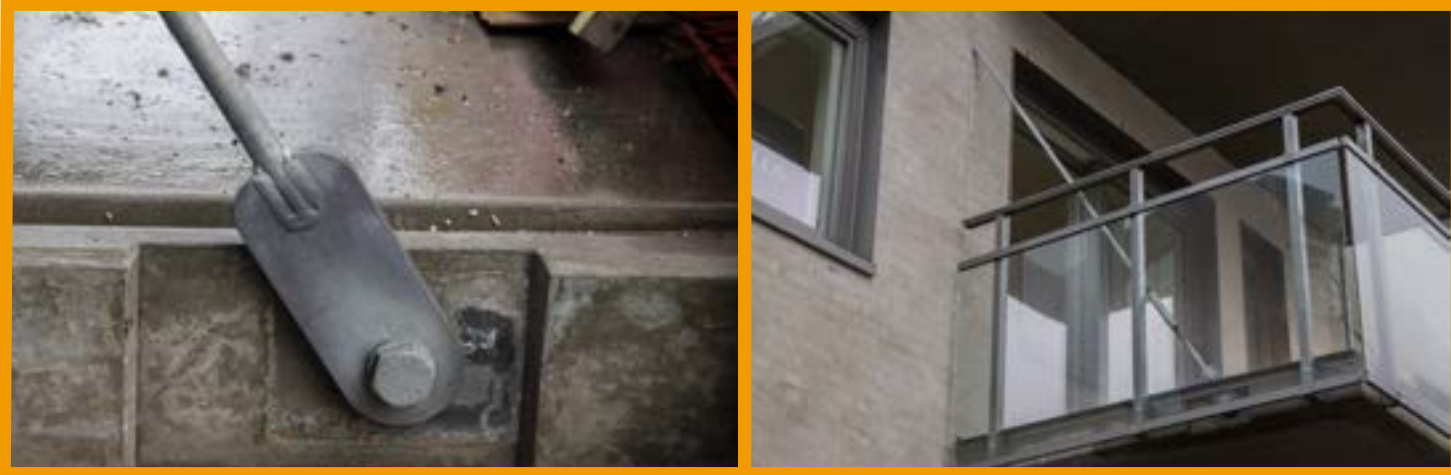
Viser innfesting mot innstøpt plate med gjengehylse i balkongdekke.