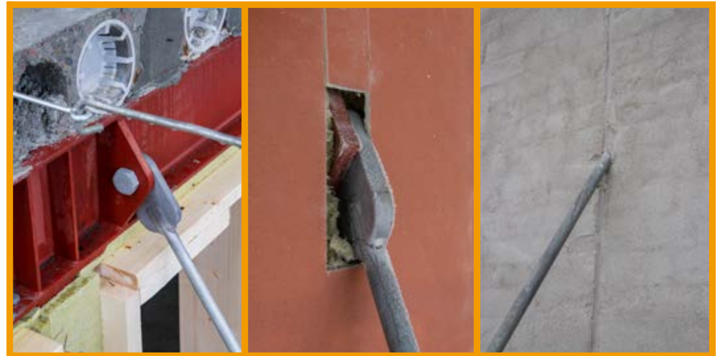
Viser innfesting mot sveiseplate mot fasade.