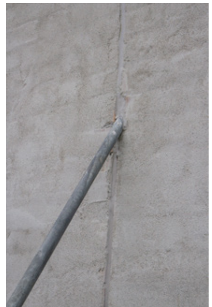
Viser innfesting mot sveiseplate mot fasade.