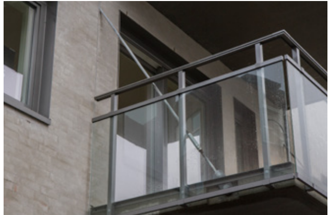
Viser innfesting mot innstøpt plate med gjengehylse i balkongdekke.