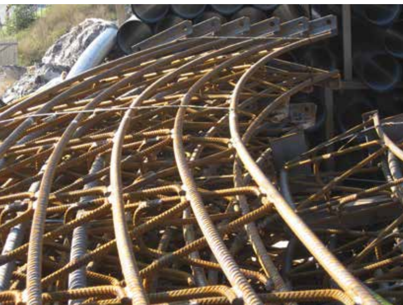
3-bar gittersystem / 3-bar girder system

BSt 500B for Ø18, Ø20, Ø22, Ø25, Ø28, Ø30 and Ø32